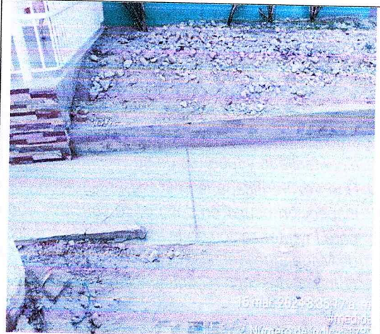
Fotografía 2: Vista general del predio