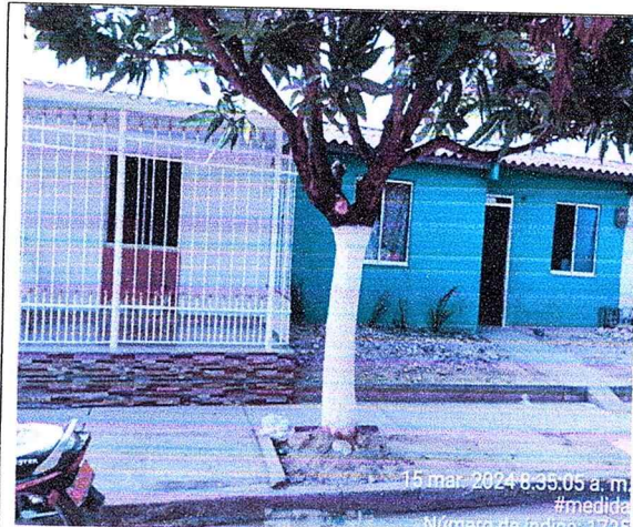
fotografía 1: Posición de los árboles en el predio